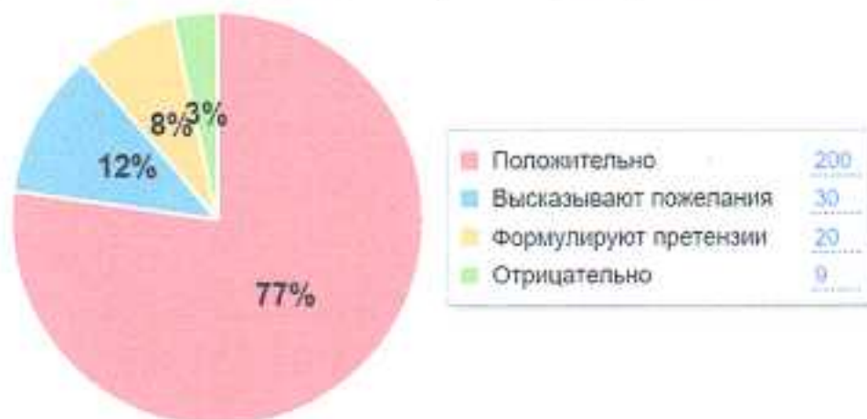
Как родители оценивают работу школы